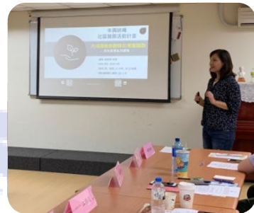
當時由 年興人資經理代表於台北社會局例會中說明專案計畫

每月一堂 2.5 小時的「拼布培力班」，年興不僅贊助四台桌上型縫紉機供課程使用、協調紡織廠捐贈次布再利用及相關課程教材，還安排由台北總部各部門輪流徵召、擔任協助課程進行與關懷學員的志工。