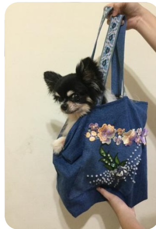
將材料再利用、發揮創意展現獨一無二的巧思設計