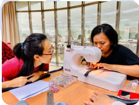
學員間的互動與彼此鼓勵更加成了培力班的具體效益

許多不及備載、默默付出的年興同仁們，不以事小而不為，一同與公司關心社會需要、正視女權、以及兩性就業平權的議題，明白公司為下個階段所需之軟實力的培養所展現的決心。