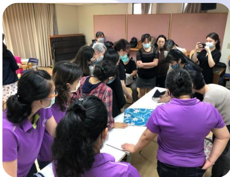
年興志工(主管)帶著部門同仁 一同參與課程進行、關心陪伴學員的學習歷程