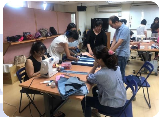
姚老師與年興志工(主管)討論布紋 分享產業知識

充其量僅是位媒合者，負責將資源整合， 投注在能加成其價值的服務上；除了媒 合老師及社福單位之外，也是所有投入