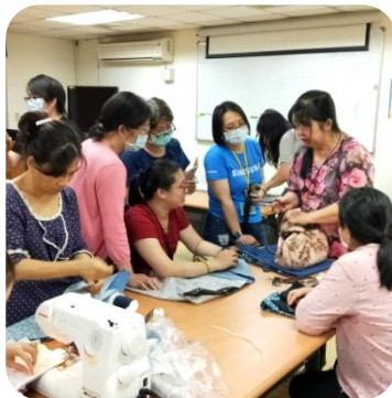
姚老師耐心提點與講解步驟

認真投入。即便每位學員都帶著各自的故事來到這，但在「拼布培力班」中，透過對願景的明確刻畫、對技術的具體賦能、與對生命的真實關懷，讓這些婦