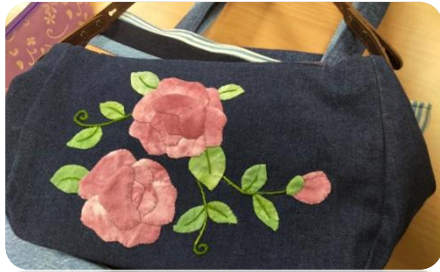
學員依老師的範例做的提花裝飾

罹患了焦慮症，生活總在擔憂和浮動的情緒中度過。去年(2019年)經由轉介報名了年興與內湖婦女之家的「拼布培力班」學習布藝後，她開始體會到縫紉