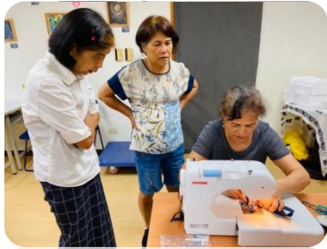
不論是否有拼布經驗，在「培力班」訓練下皆培養出實戰技能

作法；成衣業務部及生管部主管積極地在課堂中幫助學員認識布紋...等提供產業基礎知識。甚至有成衣生管部同仁在單次服務後仍持續關心此計畫，熱心地