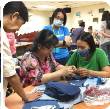
學員們專注地看老師示範