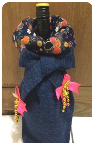
將布材重組做出具個人特色的紅酒袋