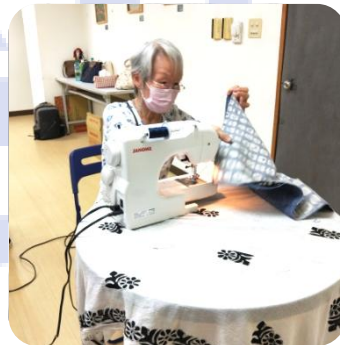
保持願意學習的心超越年齡的自我設限

三方合作努力下，弱勢婦女培力暨就業脫貧的服務計畫開展，成為雇主價值觀、領導者影響力、以及企業責任的延伸，一針一線、織出生命故事的新篇章、織出一線新希望!