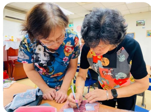
學員們相互合作幫助、一步步完成作品

這一年的服務中，有打版室同仁運用職 務技術所長，在聽完老師的講解後化身 助教，主動協助指導學員、解惑與提點