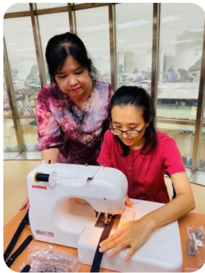
姚老師認真地做個別指導

女學員們不僅專注於手作，更享受作品帶來的成就感與滿足感。在老師課中及課外的引導下，無形中更是向他們傳達「拋開過往、活在當下」的盼望。而課程後由內湖婦女暨家庭服務中心的社工人員介入關懷、輔導與建立關係，一同在他人的需要上看見責任。