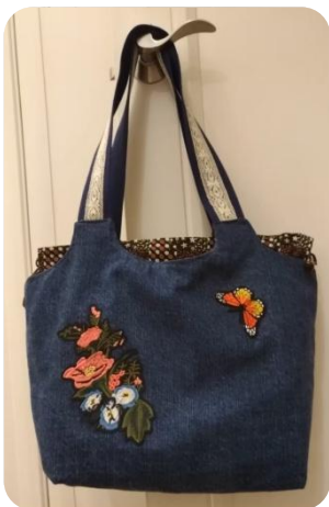
學員作品充分發揮牛仔布製作實用耐用的手作商品