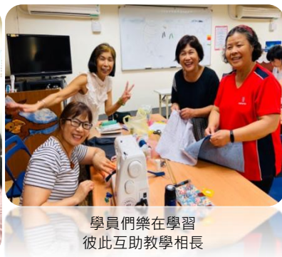
學員們樂在學習 彼此互助教學相長