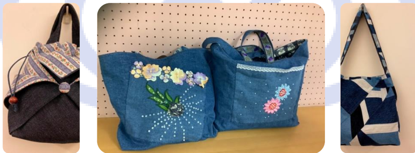
十堂課累積超過十種商品製作方法 奠定學員們的基礎實作能力、達到培力目的

還有許多超乎最初服務期望的生命故事與改變正在發生，透過這份簡短的報告書，一來回顧年興總部這一年社區關懷所投入的過程；二來也拋磚引玉邀請各位朋友們給予建言、啟動影響力的漣漪效應，攜手關懷與正視他人需要！